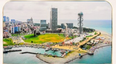
เมืองชายทะเล บาดูมี