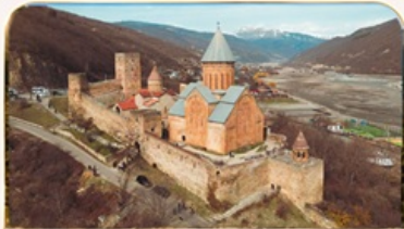
ปิธอนานูรี