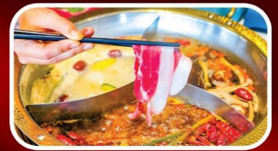
ชาบูหมาล่า