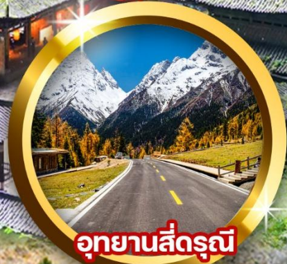
อุทยานสี่ดรุณี