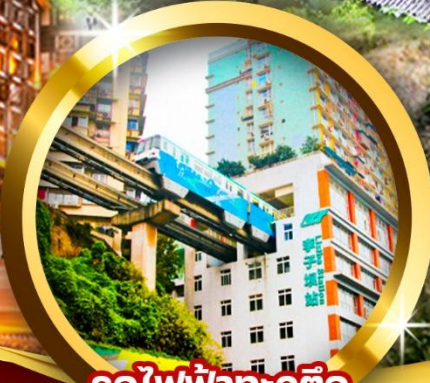
รถไฟฟ้าทะลุтик