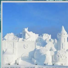
“ASAHIKAWA SNOW FEST”