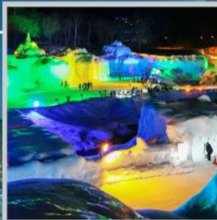
"SOUNKYO ICE FEST"