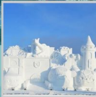
"ASAHIKAWA SNOW FEST"