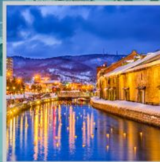
"OTARU CANAL FEST"