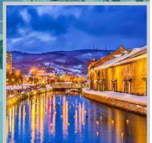
“OTARU CANAL FEST”