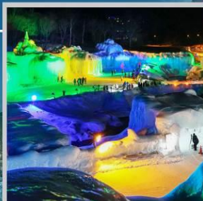
“SOUNKYO ICE FEST”