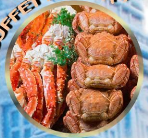
SAPPORO SNOW FESTIVAL 2027