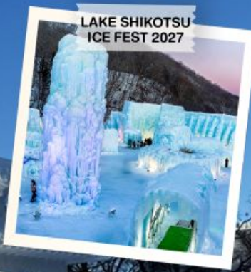
LAKE SHIKOTSU ICE FEST 2027

TOMAMU / FURANO / BIEI / ASAHIKAWA / SOUNKYO / OTARU / SAPPORO