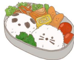
● อาหารสำหรับเด็ก ( 2-11 ปี ) *วัตถุดิบขึ้นอยู่กับทาว์ราน