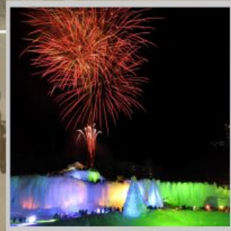
"SOUNKYO ICE FEST"