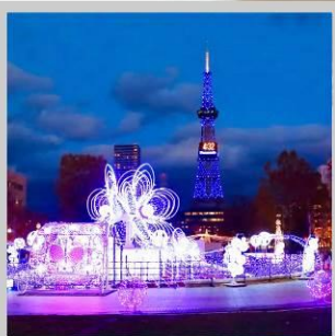
“SAPPORO WHITE ILLUMINATION”