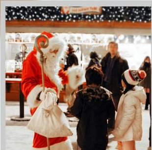
“ODORI GERMAN MARKET”