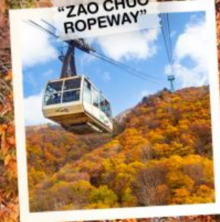
"ZAO CHUO ROPEWAY"

วันเดินทาง 30 ต.ค. - 5 พ.ย. 2569 4 - 10 พ.ย. 2569