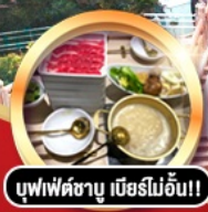
บุฟเฟ่ต์ซาบู เภียรโมอัน!!