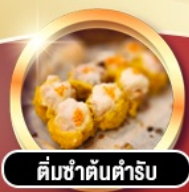
ติ่มซำคั่นตำรับ

гаринดี!! พักทรู 4 ดาว PRUDENTIAL HOTEL ติดถนนนาธาน ย่านช้อปปิ้งจิมซาจуй