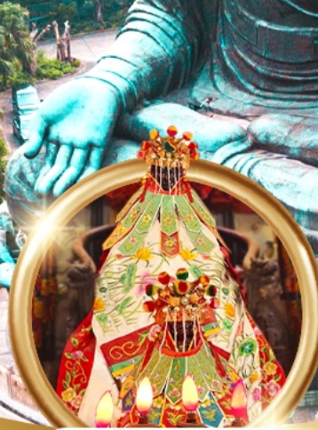
ยืมเงินเจ้าแม่กวนอิมสองฮา