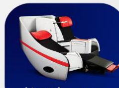
ที่นั่งพรีเมียมแพลตฟอร์ม