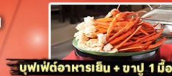
บุฟเฟ่ต์อาหารเย็น + ชาบู 1 มื้อ

25,919 ราคาเริ่มต้น บาท รวมภาษีมูลค่าเพิ่ม 7%