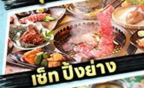
เซ็ท บิงย่าง