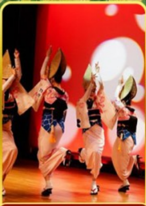
อะวะ โอะโตะริ โคคัง