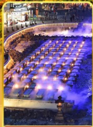
ชมยูบาคาเกะ