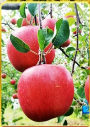
เก็บแอปเปิล