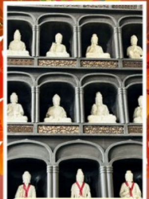
วัดไดชิซังเซโอดจิ