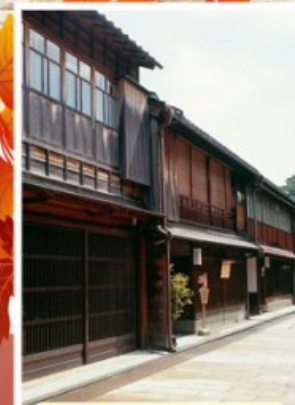
ย่านอิงาชิบายะ