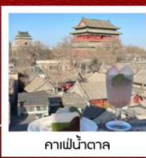
คาเฟ่ชาตาคา