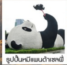
รูปปั้นหมีแพนด้าชงชี่