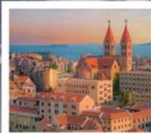
โบสถ์ ST. EMIL

ชิงเต่า · เว่ยไห่ · เหยียนโก๋ 6 DAYS 4 NIGHTS