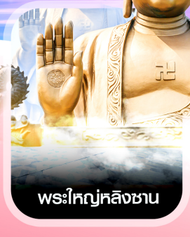
พระใหญ่หลังซาน