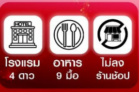
โรงแรม 4 ดาว