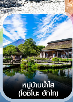
หมู่บ้านน้ำใส (โอฮิโนะ อักโก)

คอนเฟิร์ม ออกเดินทาง ทุกพีเรียด 2 ท่านขึ้นไป