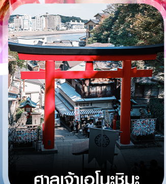
ศาลเจ้าอินะชิมะ