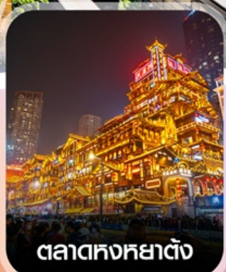
ตลาดหงหย่าตัง