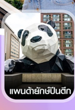
แพนด้ายักษ์ป็นตึก

✈️ คอนเฟิร์ม ออกเดินทาง ทุกพีเรียด 2ก่านขึ้นไป