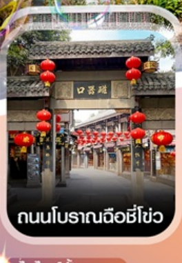
ถนนโบราณฉือชี่โฮว