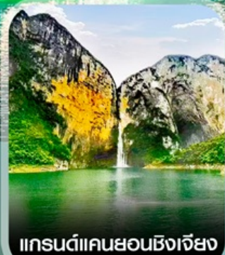
แกรนด์แคนยอนซิงเจียง