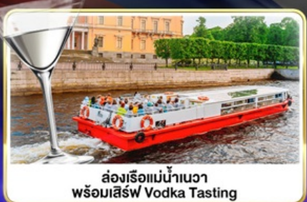
ล่องเรือแม่น้ำเนวา พร้อมเสิร์ฟ Vodka Tasting