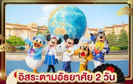
อิสระตามอริยาศัย 2 วัน