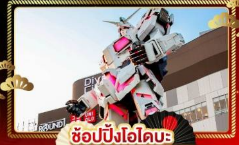
ช้อปปิงโอไดบะ