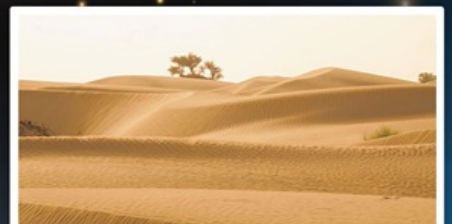
ทะเลทรายทากลามากัน