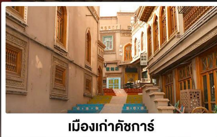
เมืองเก่าคัชการ