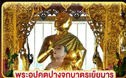
พระอุปคุตปางจากบาตรเขี่ยมาร