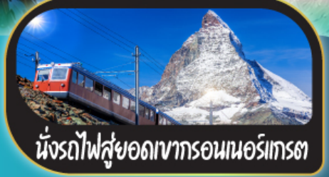
นักรถไฟสู่ยอดเขากรอนนอร์เกรต

พิเศษ!! ขึ้นกระเช้าสู่ยอดเขาอากุยคูมิตี สัมผัสวิวเทือกเขาแอลป์แบบ 360 องศา • หลงรักความคลาสสิกเมือง เบิร์น • ลูเซิร์น เดินซิลฯ ชมสงโต • โลซานน์มีศาลาไทย • แชะภาพกับน้ำพุเจกโด