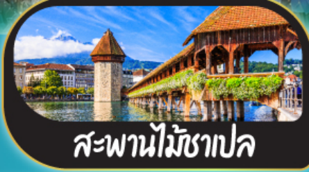
สะพานไม้ชาปล