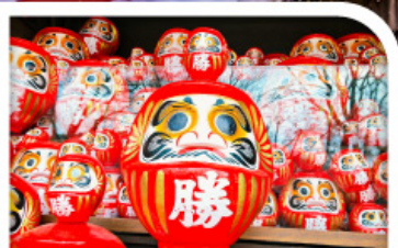
วัดแห่งชัยชนะ: วัดคัตสึโอจิ(วัดดาโรมะ)