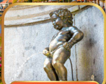
หนูน้อยมานเกินพิส