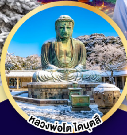
หลวงพ่อโต โดบุตสึ