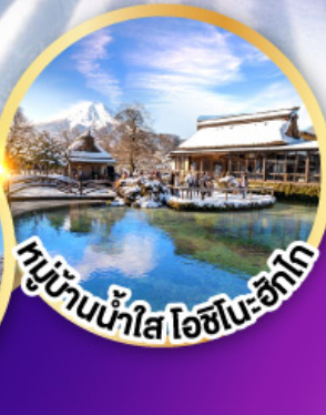
หมู่บ้านน้ำใส โอชิโมะ-อิทากิ