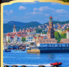
ท่าเรือประมงต้าเหลียน