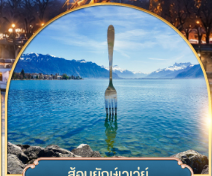
ล้อมยักซ์เวอว์