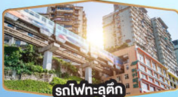
รถไฟฟ้าชุกติ