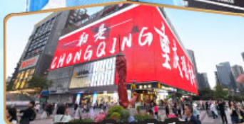
ถนนคนเดินทงวนฉีเจียว