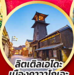
ลิตเติลเอโดะ เมืองคาวาโกเอะ