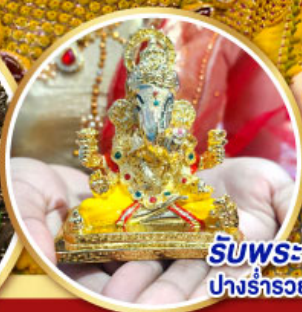
รับพระพิฆเนศวร ปางรำรอย ท่านละ 1 องค์