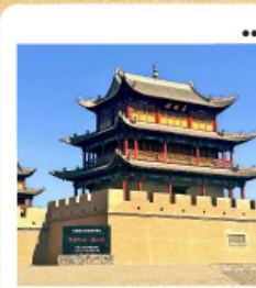
กำแพงเจียยี่กวน