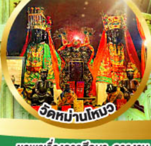
วัดบ้านโพนว

ขอพรเรื่องการศึกษา, การงาน สติปัญญาและความกล้าหาญ