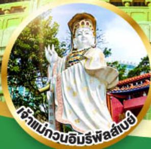
เจ้าแม่กวนอิมพรหลั่งน้ำทิพย์