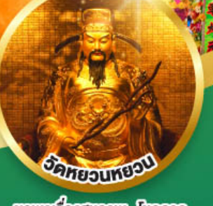
วัดทวยหนวย

ขอพรเรื่องสุขภาพ, โชคลาภ ความเจริญก้าวหน้า