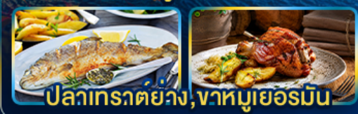
ปลาเทราต์ย่าง, จานหมูเยอรมัน

Season Germany Austria Czech of romance.. Slovenia Hungary