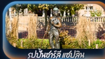
รูปปั้นชาร์ลี แชปลิน