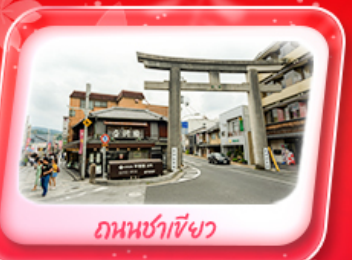
ถนนท่าเซ็งว