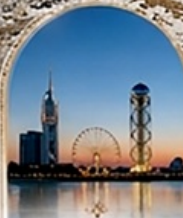
บาทุมี BLACK SEA BOULEVARD