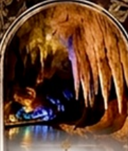
ดำโพรมิริอัส BOAT RIDE

เดินทางช่วงปีใหม่ 27 ร.ค. - 3 ม.ค. 70 ราคาเพียง 75,989 บาท / ท่าน