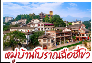
หมู่บ้านโบราณฉือชี่โจว

พระแกะสลักหินตัวจู้ - ตึกตะเกียบ Raffles City - ตึกพวยซิ่ง เทรตเตอร์เบียร์ - หมู่บ้านโบราณฉือชี่โจว