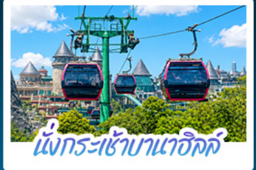
นั่งกระเช้าบานาเออิล