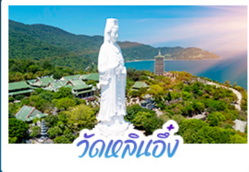
วัดเขลิเอ็ง