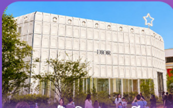
บริกกลินกาหลี่