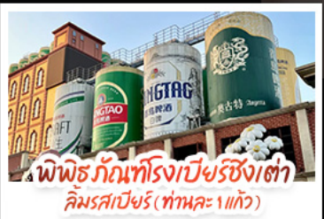
พิพิธภัณฑ์โรงเบียร์ชิงเต่า ลิ้มรสเบียร์ (ทำนอง 1 แก้ว)