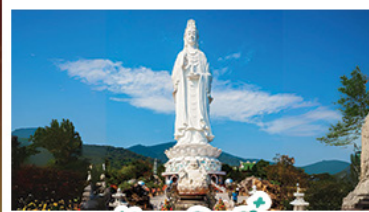
วัดเข็กนึ่ง