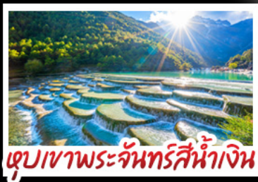
ตึกเขาพระจันทร์สีน้ำเงิน