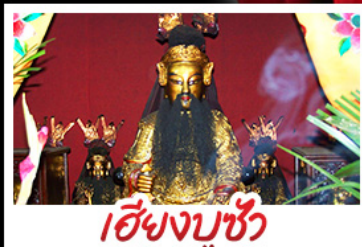
เอียงบูชัว