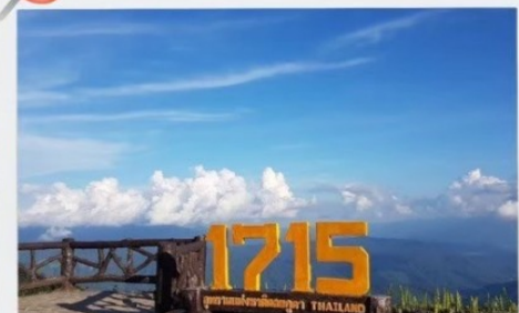
จุดชมวิวที่มีความสูง 1715