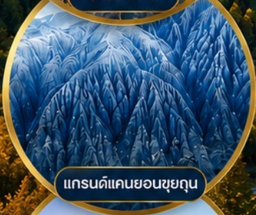
แกรนด์แคนยอนซูยกุน