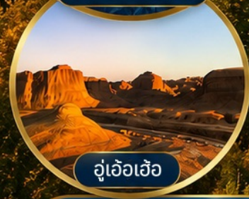
อู่เอ้อเอ้อ