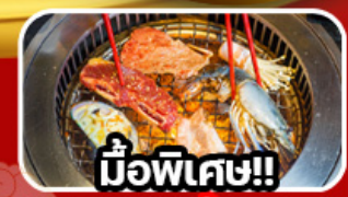
มือพิเศษ!!