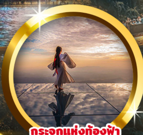
กระโจมแห่งท้องฟ้า