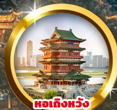
หอเกิ่งหวัง