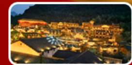
พักในหุบเขาเทวดา