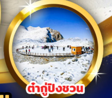
ต้ากู่ปิงชวอน